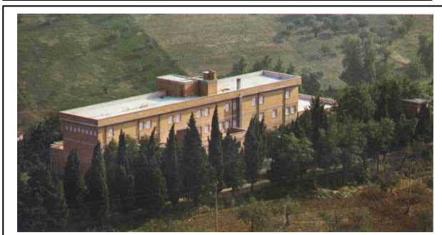
In basso: due immagini del Centro visto da lontano